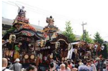
5月 山車や神輿で賑わう あきしま郷土芸能まつり