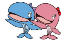
昭島市公式キャラクター アッキー&アイラン