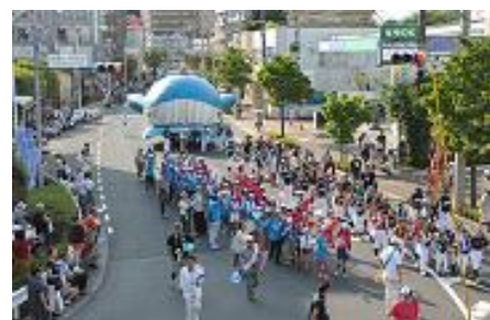
8月 くじら祭り 夜は花火で盛りあがります