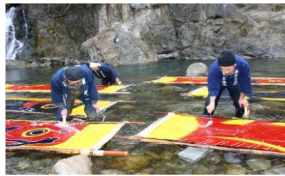
冬の風物詩 鯉のぼりの寒ざらし