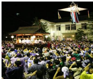
重要無形民俗文化財 郡上おどり

郡上市は、岐阜県のほぼ中央に位置し、東部は下呂市に、北部は高山市に、西部は関市・福井県大野市に、南部は美濃市・関市に接しています。最低海拔地である美並町木尾の110mから最高海拔地の白鳥町銚子ヶ峰の1,810mまで高低差が大きく、長良川源流部にあたる高鷲町の大日山麓一帯にはひるがの高原や上野高原が、明宝水沢上一帯にはめいほう高原が広がっており、雄大な自然に囲まれたロケーションとなっています。また、長良川をはじめとして和良川、石徹白川などの一級河川が24本流れており、山林の高い水源涵養能力によって美しく豊かな水に恵まれています。夏は郡上おどりが有名で多くの観光客で賑わうほか、市内には多くのスキー場やキャンプ場があり、