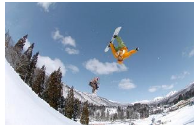
冬はスノーボーダーやスキーヤーで賑わう